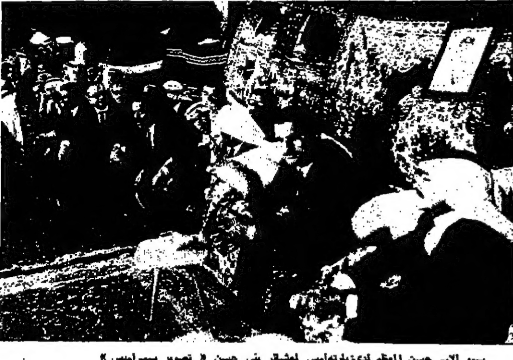
سور التي حسن المعظم كذا في راس لشاعر بني حسن

العدد ٢٢ في صفر سنة ١٣٨٨ هـ الموافق ٢٠ أيار سنة ١٩٦٨ رقم العدد ٣٩٩